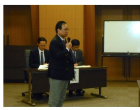
岐阜大学腫瘍外科 吉田教授の開会のご挨拶