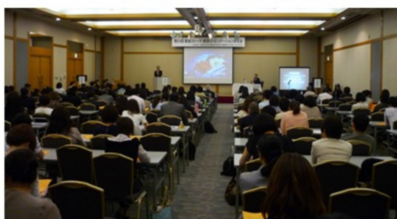
多くの方々に参加して頂きました。