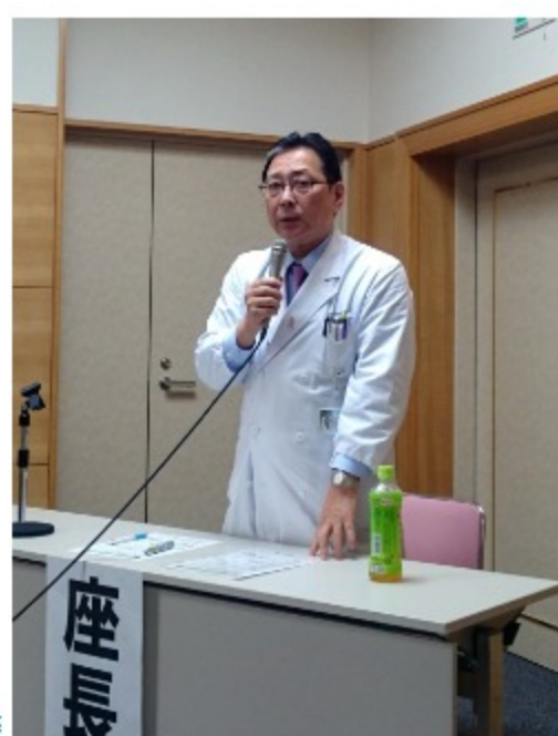
岐阜大学腫瘍外科 吉田和弘教授よりご挨拶