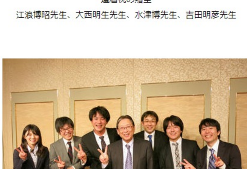
新入局・次期入局予定の先生方から一言挨拶