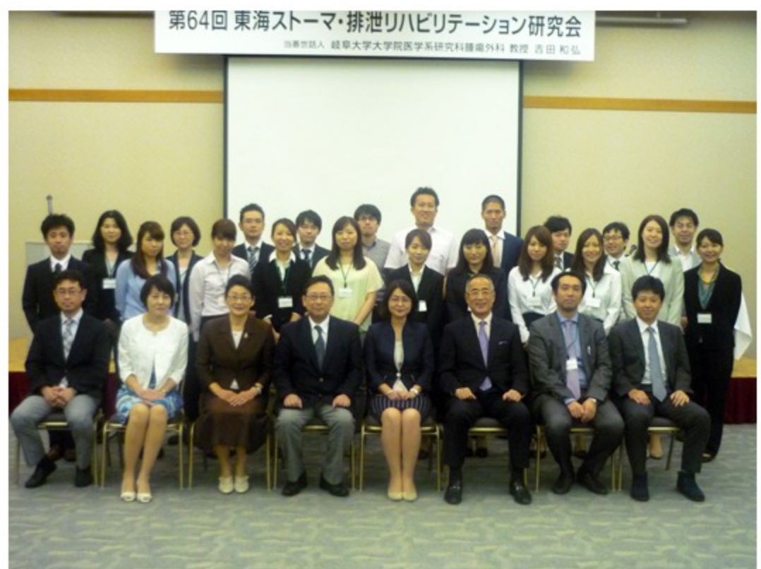
みなさま、お疲れ様でした。